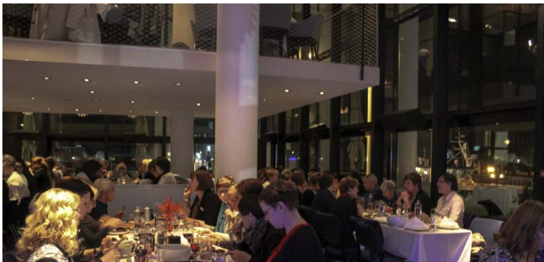
MIDDAG: Kongressen ble avrundet med middag på Du Verden.